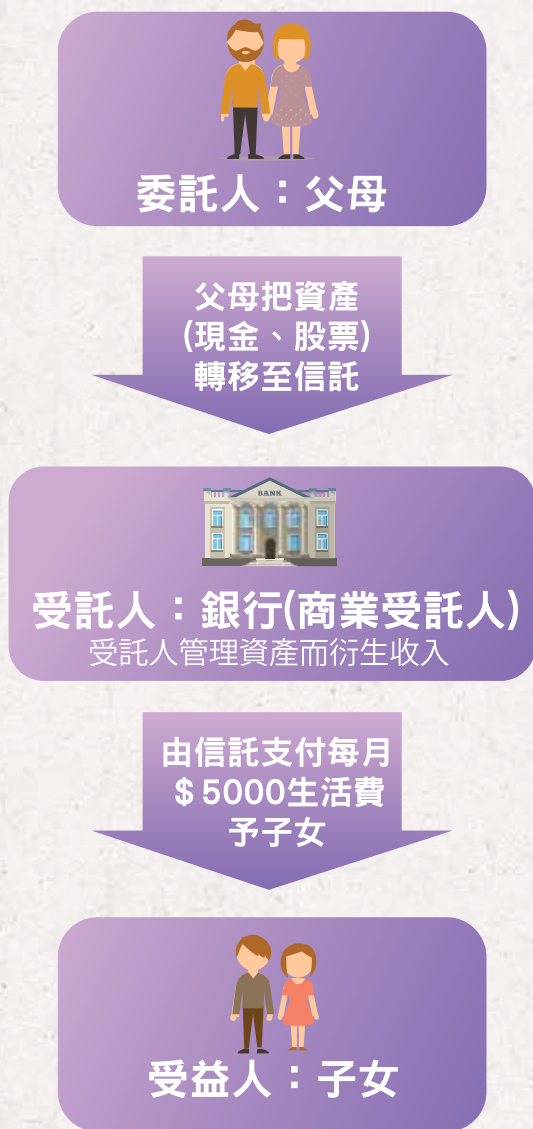
私人信託例子（圖一）

不少家長擔心自己離世後智障子女的生活，特別是財務上的安排，怕他們未能適當運用金錢，又怕他們被人騙財。理論上，家長可透過信託為子女作長遠的財務安排，以確保子女得到基本的保障。實際上，要找到可靠、義務並且具持續性的受託人絕非易事，而商業受託人（包括銀行、信託公司、專業人士等）的高昂入場門檻及管理費亦非一般家長所能承擔。有見及此，一些國家運用信託理念，為智障和特殊需要人士度身訂造一套更大眾化的保障系統。