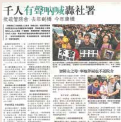
▶ 康橋事件被廣泛報導（《明報》截圖）