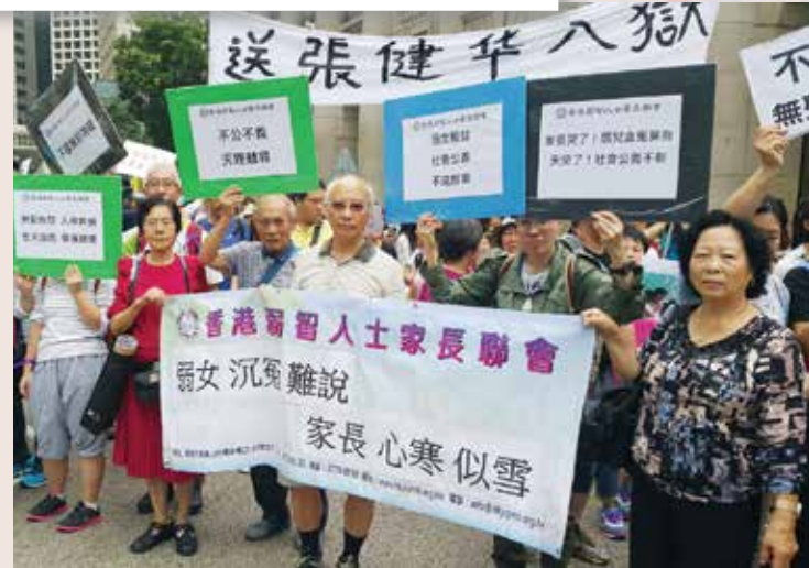
▲ 家長遊行至政府總部