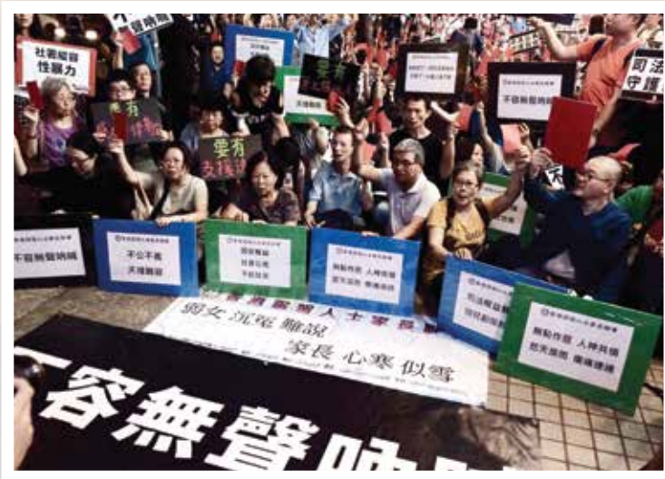
▲ 家長們到社署總部集會

「康橋之家」性侵事件震驚社會各界，聯會家長們同為照顧者，可謂感受切膚之痛。為了捍衛子女的權益，家長們再次四出奔波：