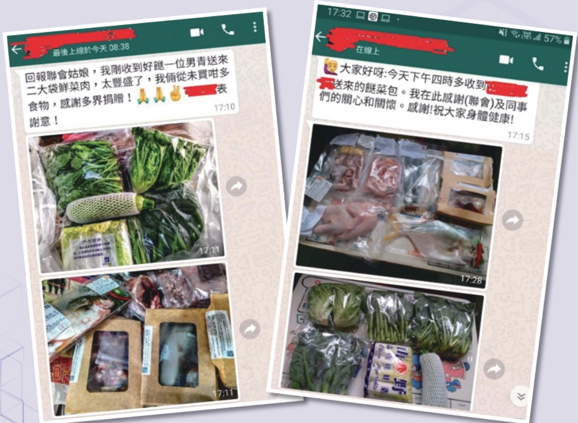
▲家長收到了聯會派發的餸菜包