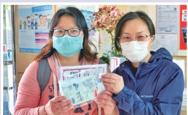
▲2020年2月向智障人士派發由社區人士捐贈之口罩