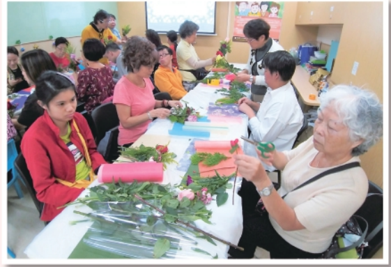
▲2019年12月1日舉行家長花藝減壓工作坊

本年度互匡社共辦行了四次會議、一次特別會議、一次退修會議及茶聚活動，熱心籌劃年度的各個活動。可惜，受到社會環境影響，原定的多個活動無奈取消。雖然如此，組員亦利用個人網絡帶來更多元的活動，如於2019年12月舉行的「家長花藝減壓工作坊」，為家長提供一個觀賞及實踐並存的花藝活動。未來互匡社將積極吸引更多區內家長參與，凝聚更豐厚的家長力量。