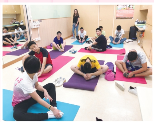
▲體適能訓練班幫助智障青少年培養運動習慣，強壯體魄

為建立智障人士的自信心而舉行不同的興趣班，既可從鼓勵參與者多自決，亦可認識朋友，擴闊社交網絡，提升社交技能，例如：園藝小組、體適能訓練課程、香薰班、普通話班等。