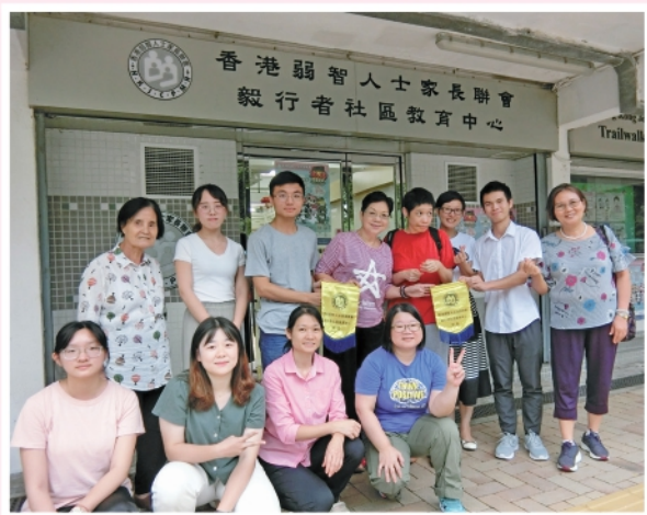
▲ 2019年8月10日江南大學及江西財政大學社工學生與本會家長進行交流