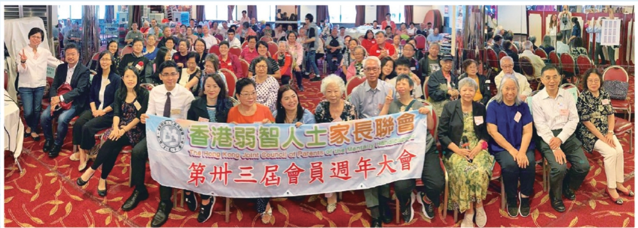
▲2019年會員周年大合照

社會不斷演變，未來我們需要更多家長加入聯會這個大家庭，希望能提供更多的新思維、發掘不同的潛能，共同與聯會前行，持續為智障人士關注權益、服務及福利，為照顧者建立互助和分享的網絡，在這個不斷變化的社會中和聯會一起適應、調整、展望和承擔。