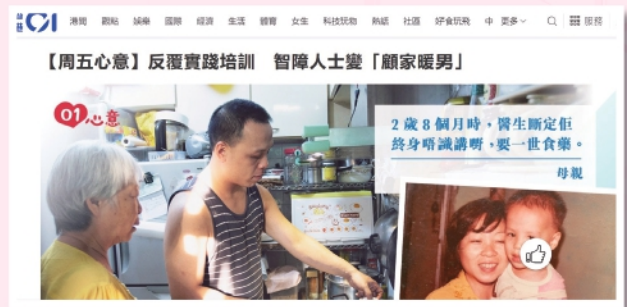
▲本會家長及智障兒子接受HK01訪問，分享人生經歷