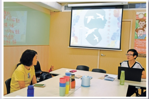
▲2019年8月17日舉行社會事件解說工作坊

本會關注智障人士及家長們在這段時期的心理調適，並於7月向會員發放WhatsApp關懷訊息，提供不同機構的情緒支援服務熱線資訊，並建議家長或會員若受到情緒困擾，亦可以向本會求助。