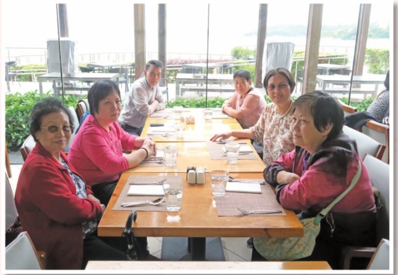
▲ 2019年5月9日互勵社組員舉行聚餐活動

除互勵社內部活動外，互勵社每季也會舉辦活動給家長會員參加，當中包括參觀院舍、探訪家長及康樂活動，讓家長對智障人士服務有更深入的认识，以及加強地區的凝聚力。