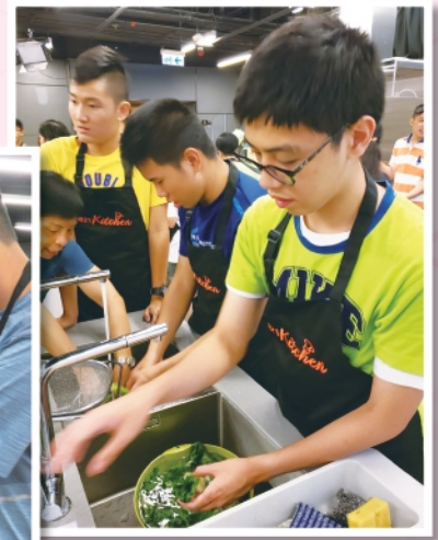
◀◀ 透過日營活動讓智障人士實踐獨立生活能力