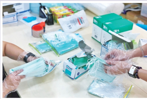
▲中心職員分裝口罩預備派發