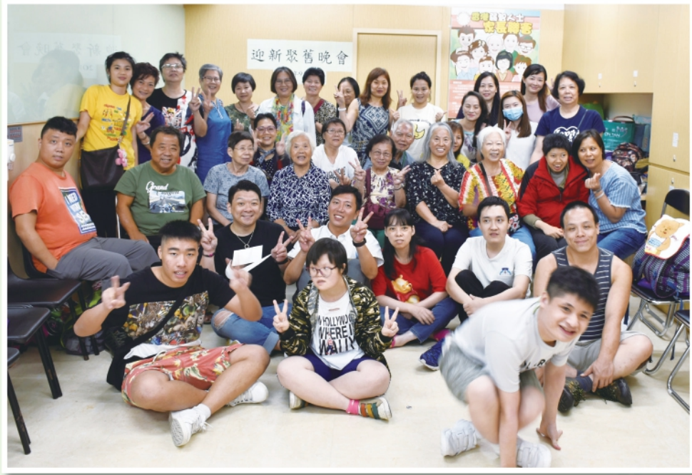
▲聯絡組定期舉行的迎新聚舊活動，協助凝聚新舊會員

聯絡組主要負責職務是關懷會員，包括：上門探訪、電話關懷、義務陪診等，其次擔任聯會活動宣傳、接待及致電會員邀約出席聯會的各项活動，如會員周年大會等。在過去的一年有賴組員不辭勞苦的協助，聯會的各项活動才得以順利完成。