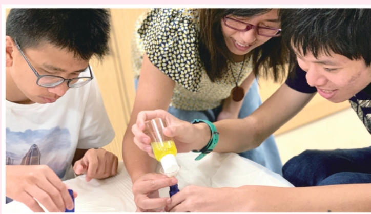
▲智障人士參與香薰班，學習調配香薰材料