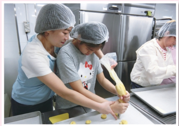
▲2019年5月4日為新里程會員舉行親子曲奇工廠體驗活動

承蒙伊利沙伯女皇弱智人士基金資助，本中心繼續推行獨立生活訓練。本年度主要以就業為主題，推行讓新里程認識咖啡師入門課程、香薰治療課程、煮食技巧及桌禮儀課程活動，希望藉此擴闊智障人士的就業出路。個人成長方面，舉行了「新里程食堂」小組，協助新里程會員提升烹飪技巧。