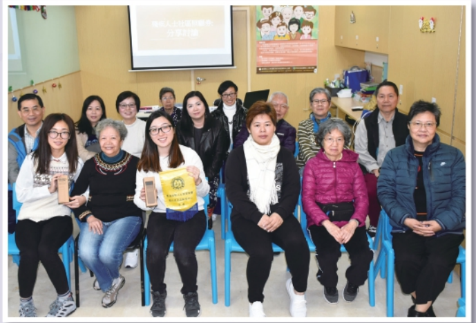
▲2019年12月3日舉行社區照顧服務券講座

期盼了十多年的香港康復計劃方案(RPP)檢討在本年度進入了中後期，對於現有服務的具體意見、RPP顧問團隊撰寫的初步意見報告，成為業界關注的重點，而本會也積極發揮著家長組織的角色，在檢討過程中召集家長召開諮詢活動的預備會、舉行講座幫助家長深入認識相關議題從而更有力地發聲，同時本會也聯合不同組織共同為RPP檢討建言獻策，希望推動未來十至二十年殘疾人士服務模式的良性轉變。