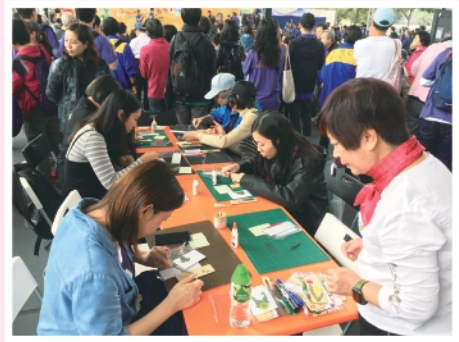
▲2019年4月13日接受東華三院邀請，舉行共融攤位遊戲