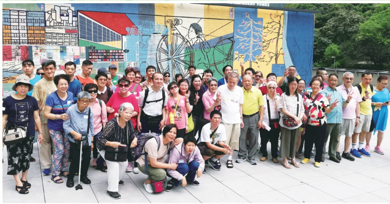
▲2019年5月19日舉行父母親節親子一天遊