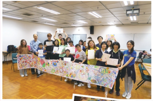
▼2019年4月7日舉行圓圈繪畫共融活動

承蒙香港公益金贊助，本中心共舉辦了6場地區推廣活動，共有304人次觀看。教育活動除了展覽以聯合國「殘疾人權利公約」為題的主題展板外，同場亦有智障朋友擔任講解大使，促進社區人士和智障朋友有更多交流機會。此外，亦舉行了6次街展推動社會增加對智障人士的認識與接納，超過1,500人次的社區人士參加。