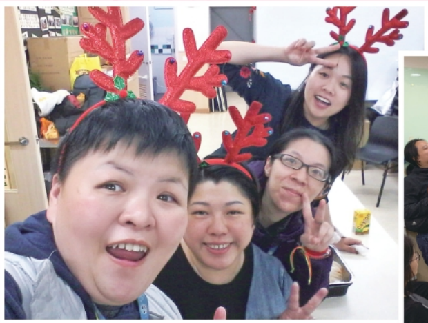
▲新里程會員參與聖誕聯歡活動

在過去一年，中心繼續為新里程義工團成員舉辦多項餘暇康樂活動，包括「新里程電影院2019」、「運動班-跆拳道訓練」、「運動班-健體舞」等；生日會及外出活動，包括生日會、中秋晚會等。中心讓新里程成員參與餘暇康樂活動，促進他們的身心健康，同時提供平台讓成員維繫友誼。