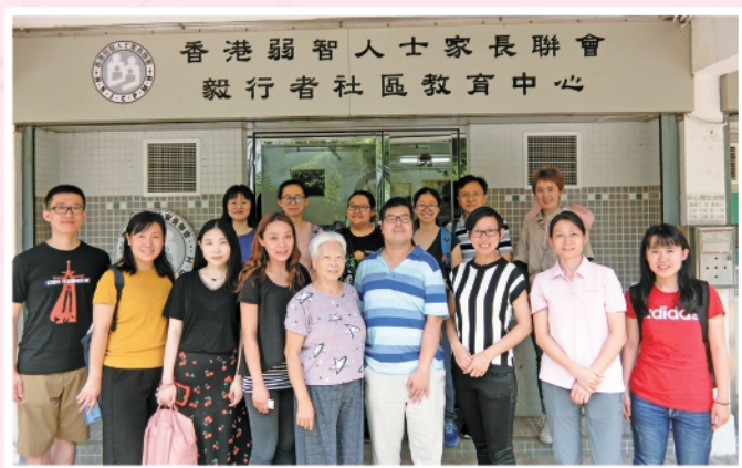
▲ 2019年7月2日北京城市大學社工學生到訪交流