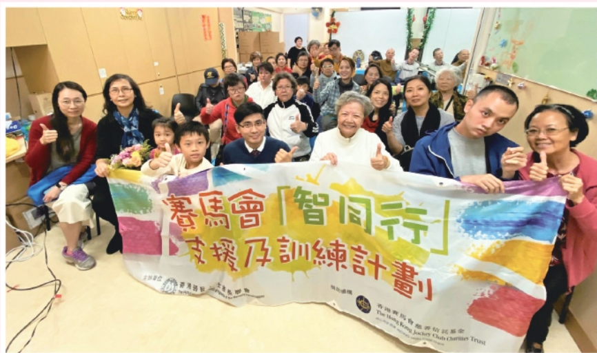
▲親子活動讓智障人士家庭增加了親子相處的溫馨時間

鑑於家庭關係對智障人士的獨立生活訓練影響深遠，因此本會舉辦了「親親天地」活動，包括親子園藝工作坊、曲奇烘焙班等。活動的過程強調親子間的合作及溝通，創造彼此之間的回憶，讓參加者深刻難忘。