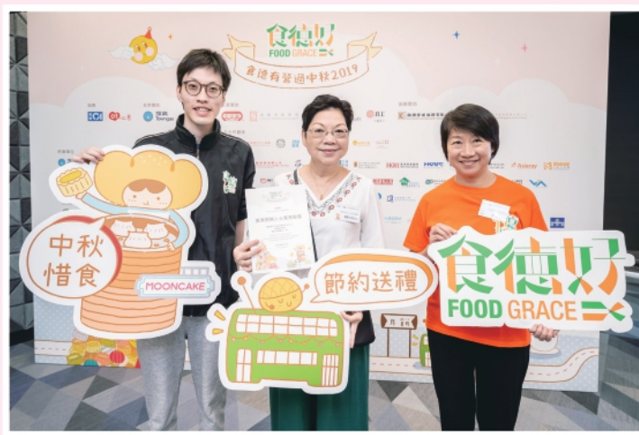
▲2019年8月15日副主席盧鄭玉珍參加「食德有營過中秋2019」約章簽署典禮

2020年1至3月受新冠肺炎疫情影響，聯會將工作重心放到籌備及寄送抗疫物資上。在此期間，來自民間的自發物資捐助如涓涓細流，持久而不斷地流向聯會。為回應各方善長，聯會上下一心，一邊致電關懷各會員，一邊迅速將籌得的物資分裝及寄送，務求將抗疫物資儘早送到有需要的智障人士家庭上手。