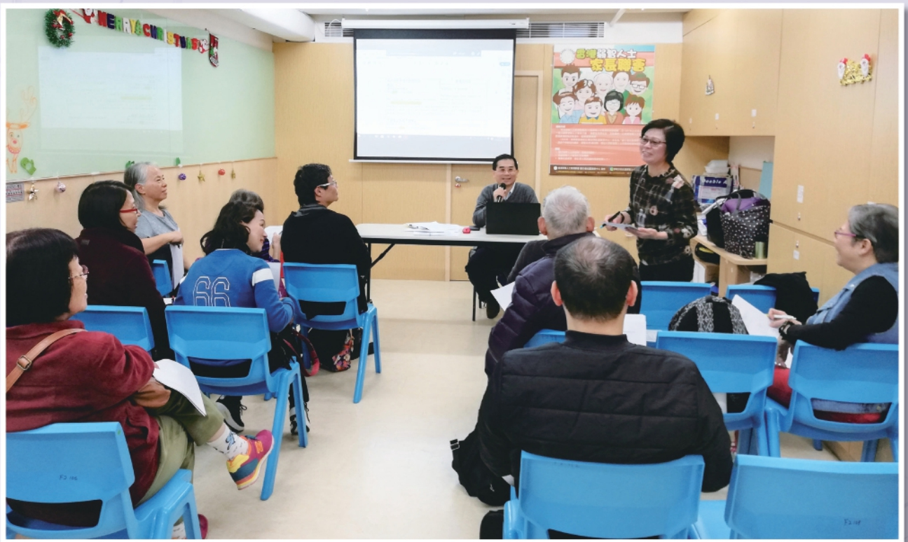
▲2019年12月12日多位家長會員參與修章諮詢會，積極提供意見

本會分別於2019年11月14日、2019年12月10日及2019年12月13日舉行修章諮詢會，瞭解到會員對於幹事會任期、選舉流程、會員類別界定等方面之重要意見。可惜的是，原計劃於2020年新春團拜當日舉行特別會員大會，通過有關章程修訂，惟因疫情而取消了是次活動。