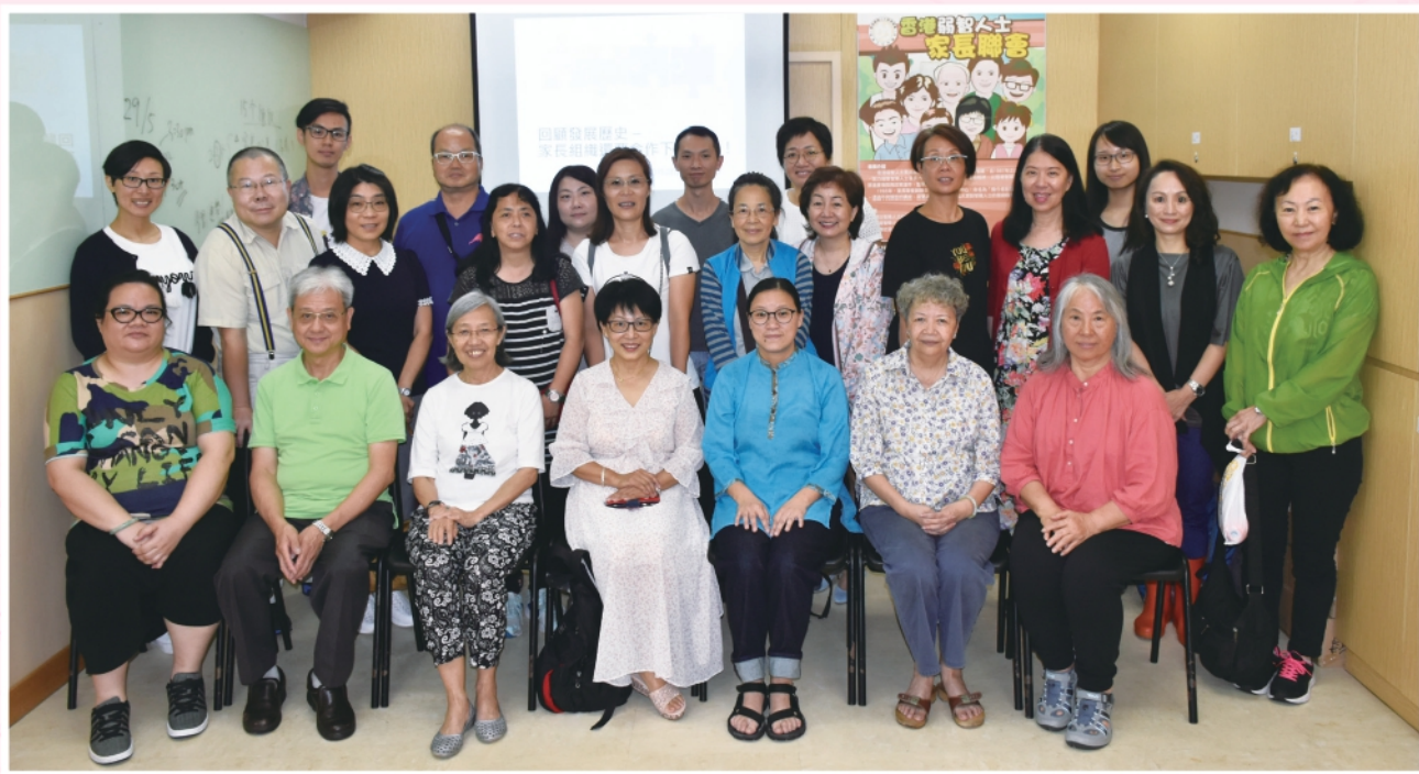
▲2019年5月28日在本會舉行家長組織座談會退修活動

此外，各組織亦透過座談會的定期會議，討論本年度如何聯合行動，共同為香港康復計劃方案檢討而提供服務持份者的角度和立場。（有關內容詳見本年報年度焦點「《香港康復計劃方案》檢討」）