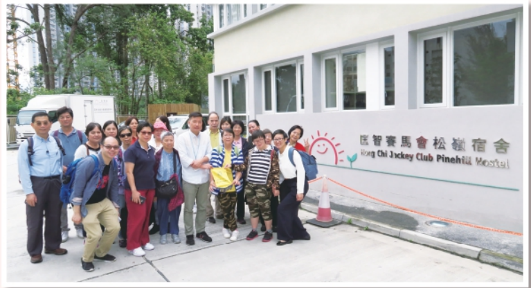
▲2019年5月30日參觀新界區復康服務機構

本年度舉行了新界東以及新界西北的復康服務參觀，瞭解智障人士資助院舍、私營院舍、庇護工場等不同服務。