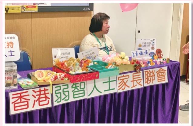
▲Aeon幸福的黃色小票義賣攤位

另外，為協助中心推行社區教育，成員會到不同學校或機構分享生活及就業情況，亦會協助裝拆展板的工作。義工團參與義務工作，除了關懷有需要人士，對社會作出貢獻，還能令大眾認識智障人士。