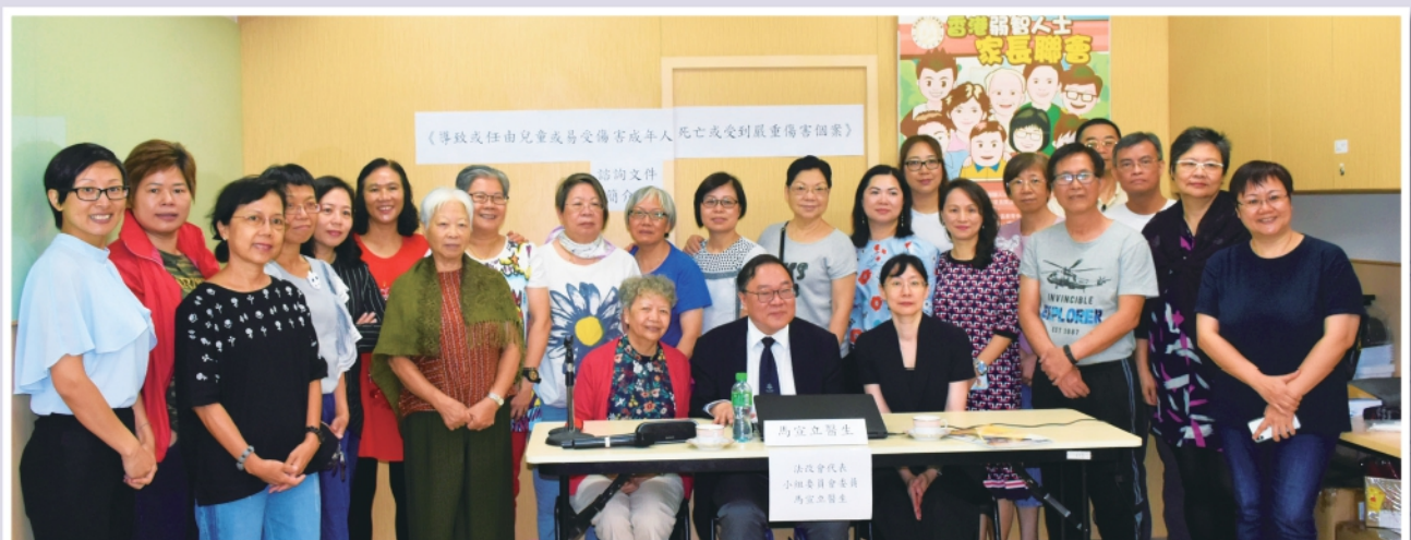
▲ 2019年7月3日邀請法改會代表簡介「沒有保護罪行」