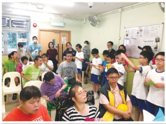
2019年舉行的共隔活動▲▶