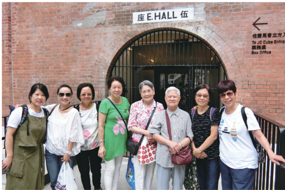
▲ 2019年5月16日互持社舉行大館一日遊