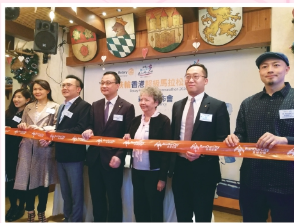
▲2019年12月18日 扶輪社超級馬拉松新聞發佈會

國際扶輪3450地區每年均會舉行超級馬拉松活動，本年度訂於於2020年2月16日舉行，本會榮幸受邀成為是次馬拉松的受惠機構之一。雖然超級馬拉松活動因疫情而取消，但宣傳和招募期間亦為本會籌得善款超過4萬元。