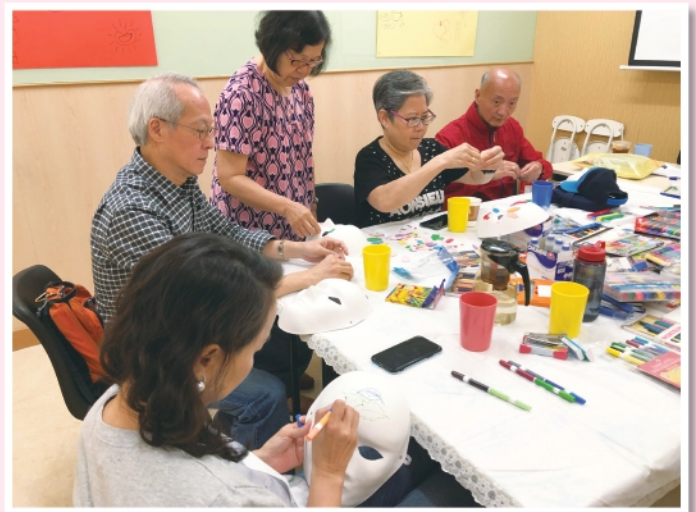
▲ 家長小組互相交流教養心得，舒緩照顧壓力

目的為增加照顧者間的互助精神及探討管教智障家庭成員的方法。小組暫時進行了兩節，因疫情的影響，由2月開始的小組需要延期。