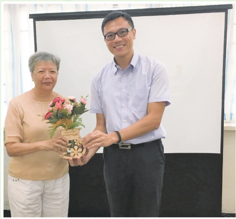
▲本會家長與復康機構分享特殊需要信託

本年度，小組成員繼續關注特殊需要信託的試行情況，並為新生精神康復會田景庇護工場等復康機構舉辦平安紙及特殊需要信託服務介紹之講座。