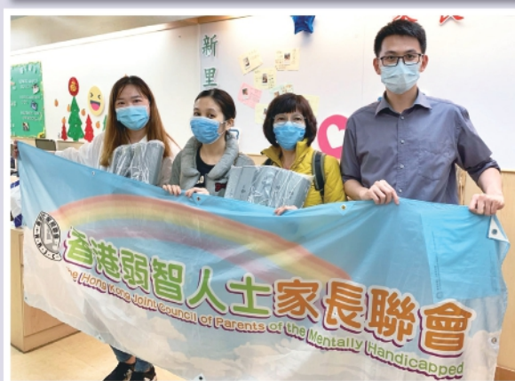
▲多個愛心團體及社區人士向本會捐贈看抗疫物資