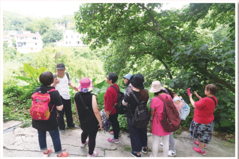
▲2019年5月14日南丫島草本尋芳導賞團

新東茶聚主要集中連繫沙田、大埔區以及北區的智慧人士家長。本年度小組繼續與香港婦女中心協會太和中心合作，假大埔區之活動場地舉行聯合活動。本年度舉行的活動包括南丫島「草本尋芳」導賞團等。