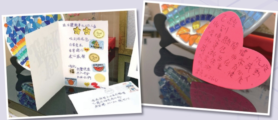
▲收到抗疫包的家長寄來感謝信

本會亦於2020年3月成功申請賽馬會新冠肺炎緊急援助基金50萬元，並從3月開始為有需要的智障人士家庭提供抗疫包及「送餸上門」服務，以緩解他們在購買抗疫物資及生活用品的壓力，同時亦減少他們出門購物的次數，降低受感染之風險。