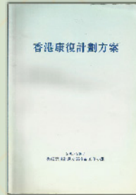
• 05-07 《香港康復計劃方案》

衛生福利及食物局在 2005 年 3 月成立了一個 25 人的檢討工作小組，檢討工作長達兩年，主要目的是為未來的康復政策和服務訂定策略性的方針和優先次序，並將之匯編成新的《香港康復計劃方案》。